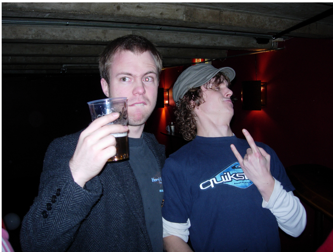
Full fest, ikkje minst takka vere pubgutane.